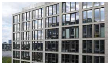
16-19 Mühlenstrasse Berlin, Allemagne