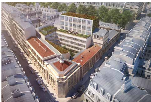
39 Avenue Trudaine - 75009 Paris (VEFA)