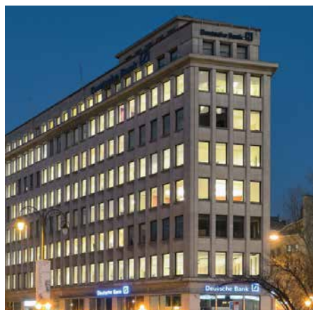
13-17 Marnixlaan 1000 Bruxelles - Belgique