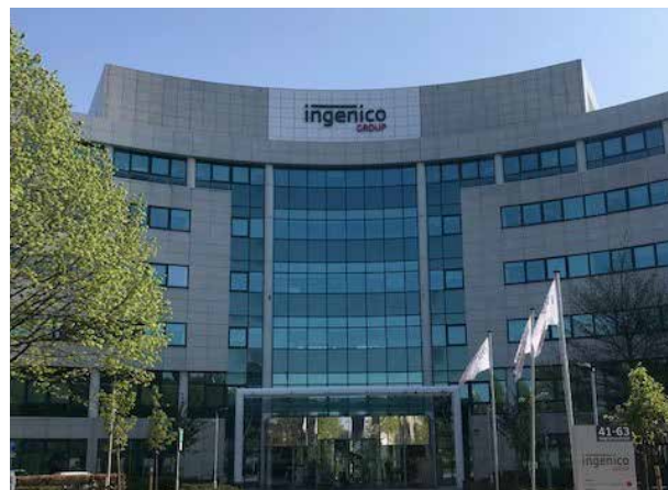
41-63 Neptunstraat Hoofddorp - Pays-Bas