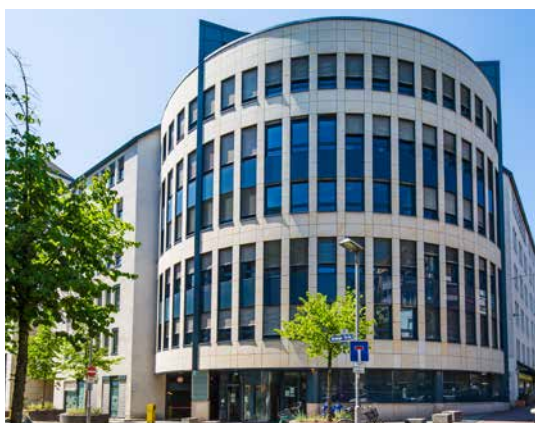
BBW - Grafstrasse / Wildungerstrasse Francfort, Allemagne