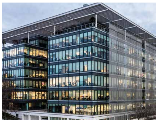
El Portico, Calle Mahonia 2 - Madrid, Espagne