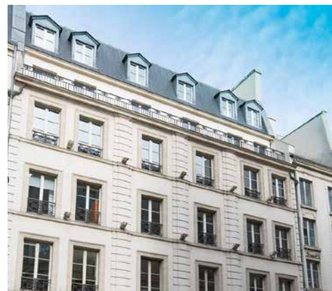
94 rue de Provence - 75009 Paris