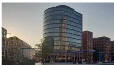
Postdamer Platz 10, Berlin, Allemagne