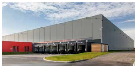
Zac de la Butte aux Bergers - 95380 Louvres