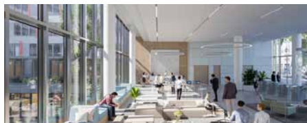
L'Académie 89-91 rue Gabriel Péri - 92120 Montrouge (VEFA)